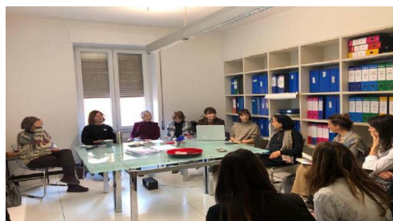
Un Incontro di advocacy in Italia

Le raccomandazioni chiave per l'implementazione di approcci trauma orientati sono state presentate attraverso delle presentazioni, sottolineando gli ostacoli e le lacune nei sistemi di giustizia e di assistenza sociale. Inoltre, i partecipanti sono stati informati sulle attività di Casa Phoebe , che si distingue per l'implementazione di pratiche trauma orientate.