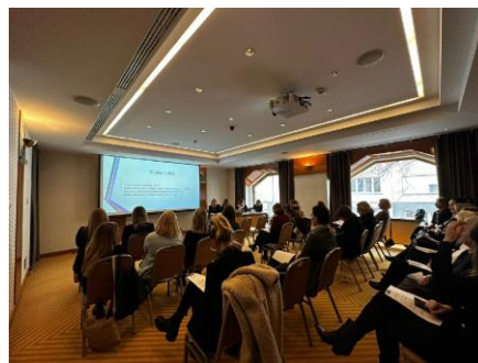
Incontro di advocacy in Croazia

In Croazia, la Casa Autonoma delle Donne di Zagabria ha organizzato un incontro di advocacy con i responsabili dei servizi e dei dipartimenti delle istituzioni competenti, del mondo accademico e delle ONG il 24 gennaio 2024 a Zagabria, presso l'Hotel Dubrovnik. L'obiettivo dell'incontro era quello di informare i partecipanti sull'approccio trauma orientato e sulla sua rilevanza nel lavoro quotidiano con le donne sopravvissute , nonché di presentare i risultati della ricerca condotta nell'ambito del progetto Care4Trauma. Infine, è stata presentata ai partecipanti una serie di raccomandazioni derivanti dai risultati della ricerca, completate anche dai feedback ricevuti dai servizi specializzati per le donne e dalle ONG durante il precedente workshop di consultazione. I partecipanti sono stati invitati a prendere parte alla discussione sulle raccomandazioni e sul loro futuro utilizzo nelle pratiche. All'incontro, che si è tenuto dalle 10:00 alle 13:15, hanno partecipato 26 persone .