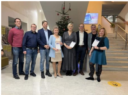
Incontro di advocacy in Estonia, 21 dicembre 2023

di approcci informati sul trauma in vari settori, tra cui l'istruzione e l'assistenza sanitaria. In definitiva, la promozione di pratiche trauma informate presso i responsabili politici mira a promuovere la guarigione, la resilienza e il benessere della società creando comunità più compassionevoli e comprensive.