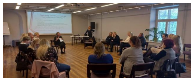
Programma di formazione in Estonia