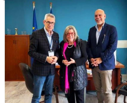
Incontri di advocacy in Grecia